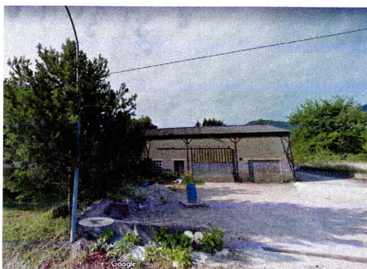
Vue du hangar proche de la RD 697