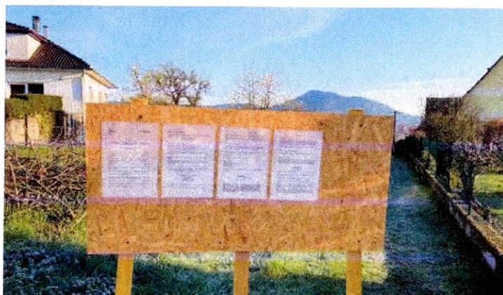
Affichage sur le terrain